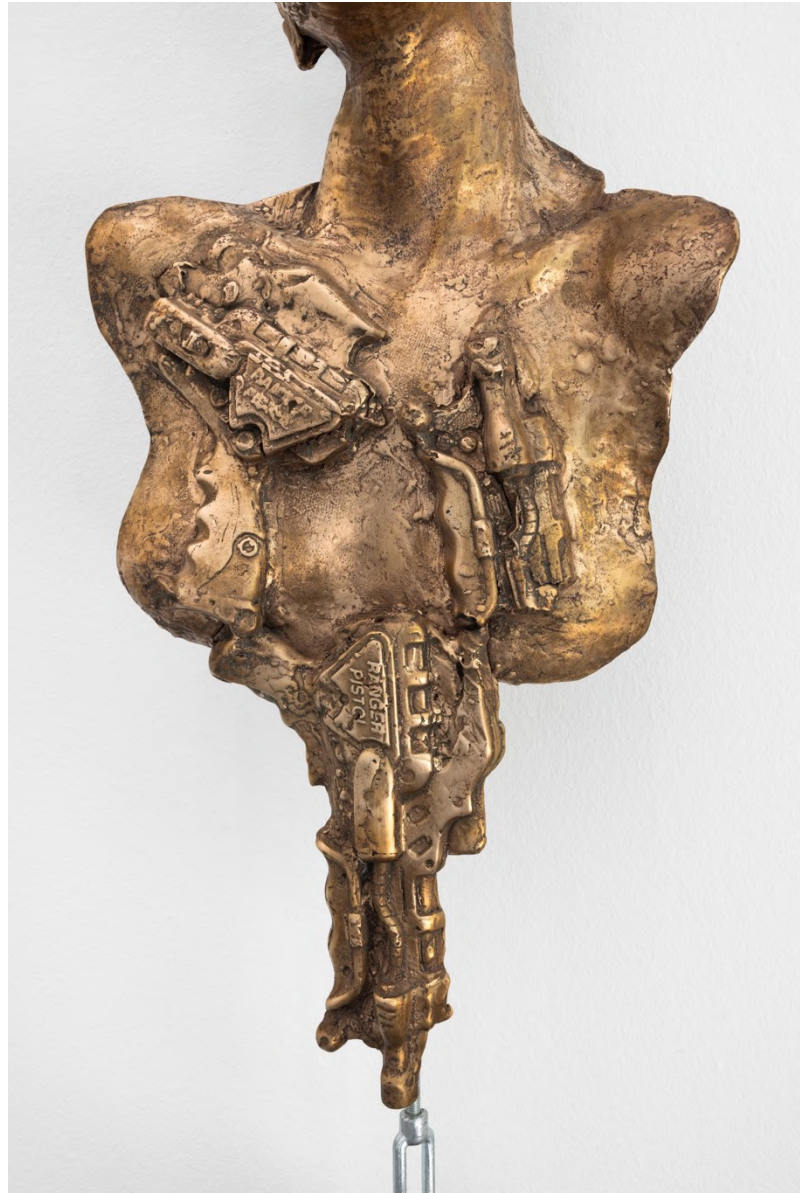
second best scenario, 2022 Installation view at Francesca Minini, Milan