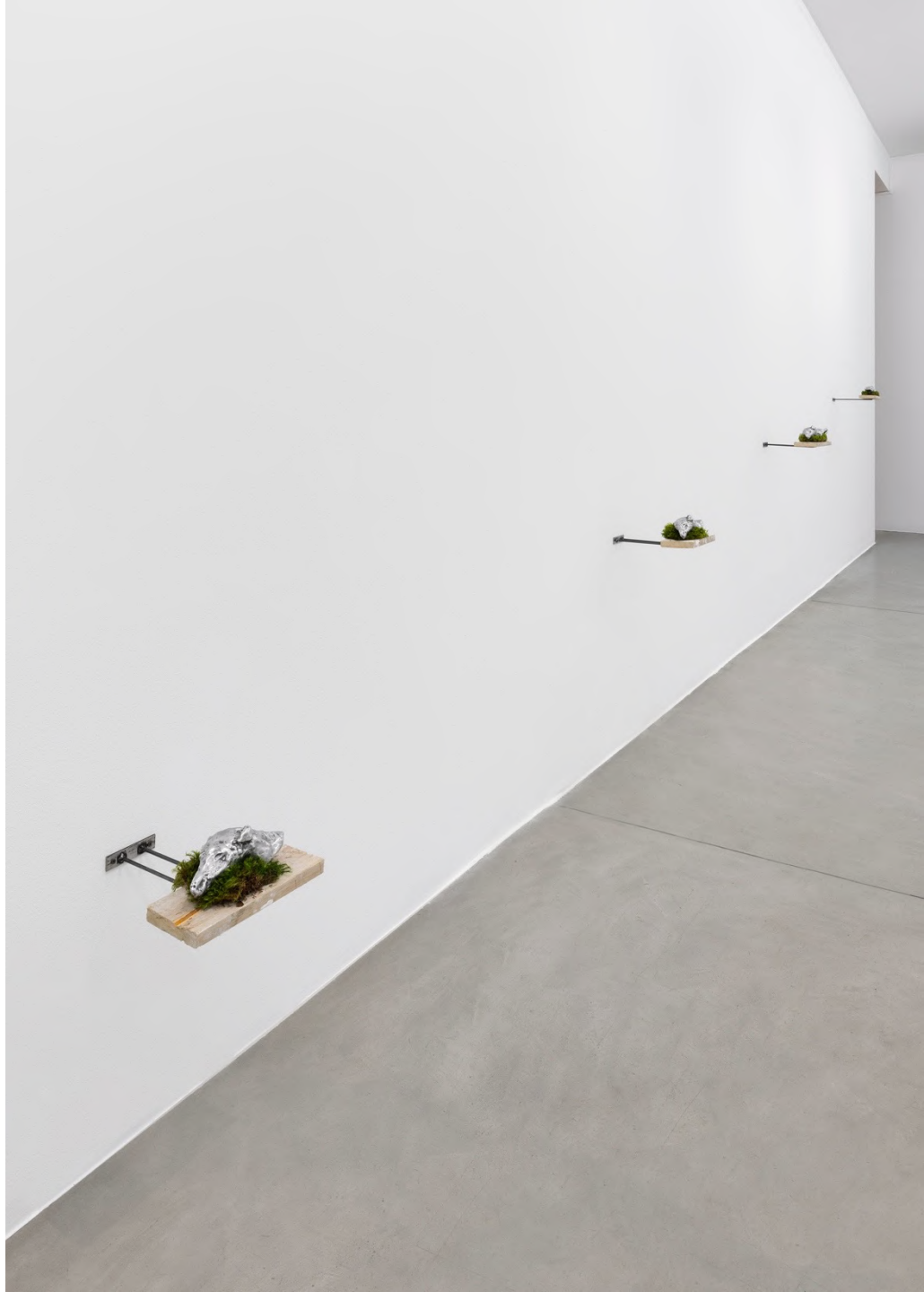
la Zona , 2023 Installation view at Francesca Minini, Milan