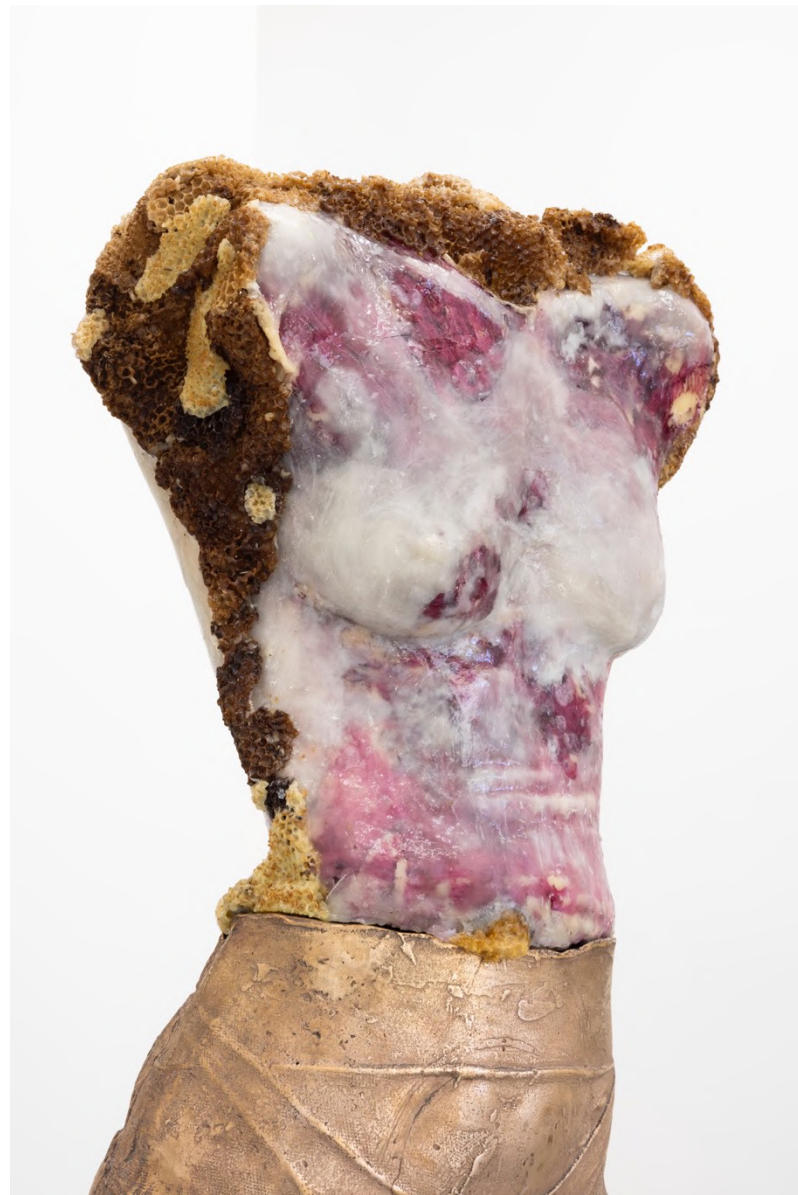
second best scenario , 2022 Installation view at Francesca Minini, Milan