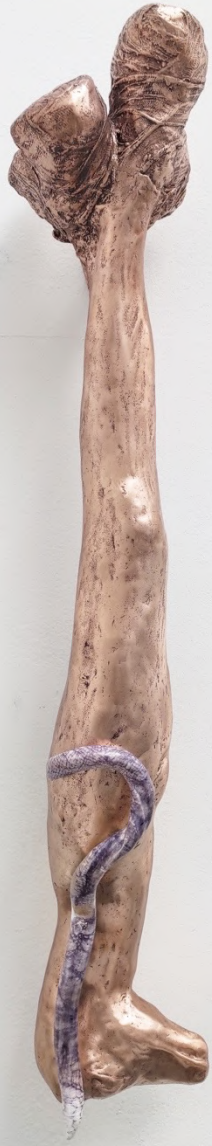
The Milk of Dreams, 2022 Installation view at La Biennale di Venezia, Venice