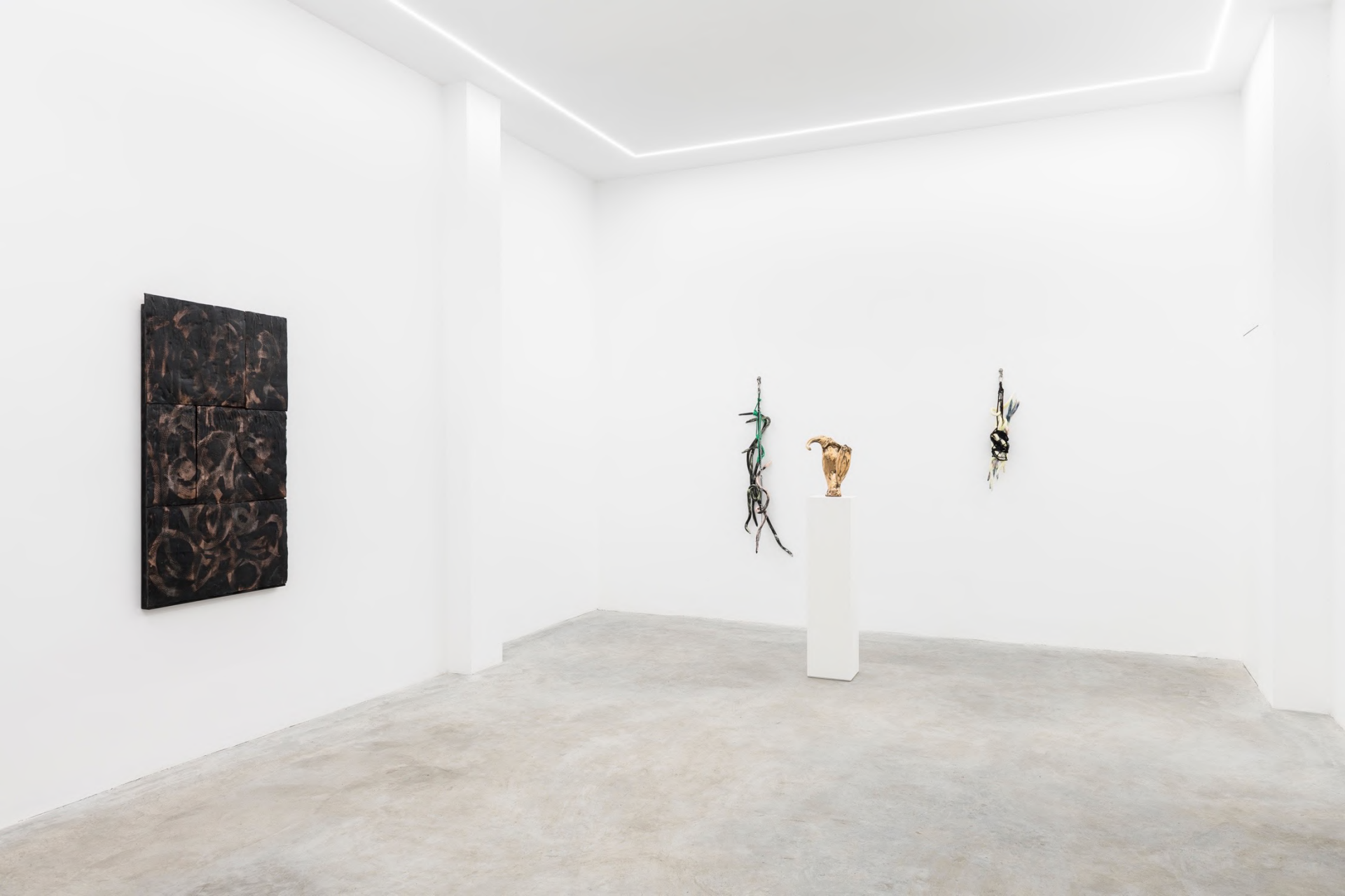
Aphros , 2022 Installation view at Rolando Anselmi Galerie, Rome