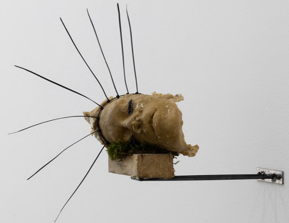
la Zona , 2023 Installation view at Francesca Minini, Milan