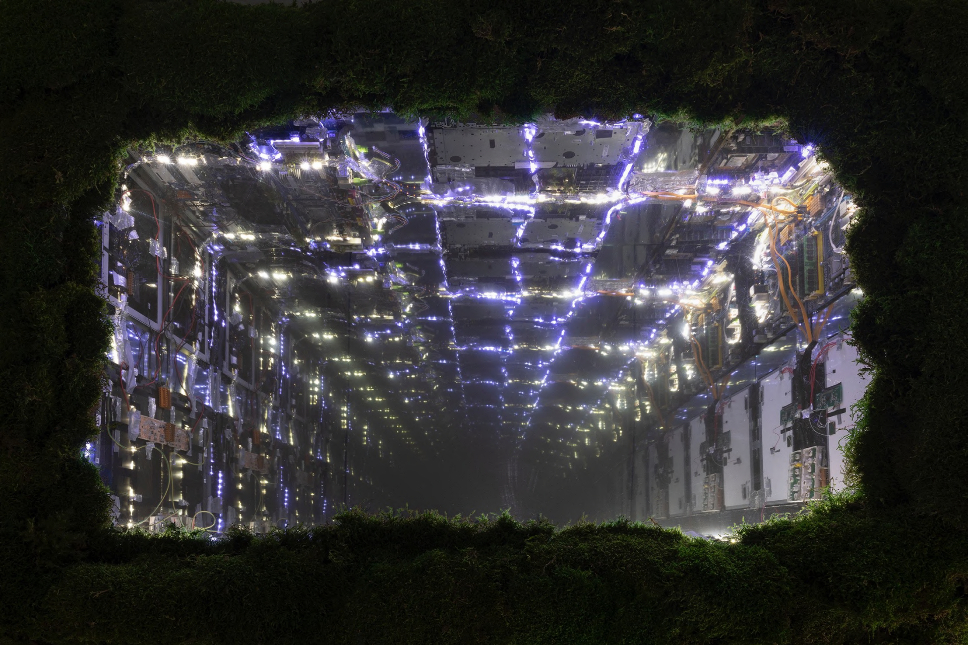
la Zona , 2023 Installation view at Francesca Minini, Milan