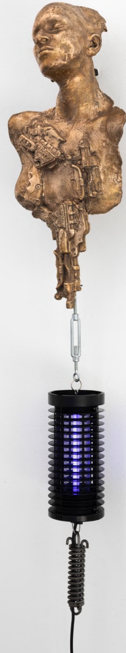
second best scenario, 2022 Installation view at Francesca Minini, Milan