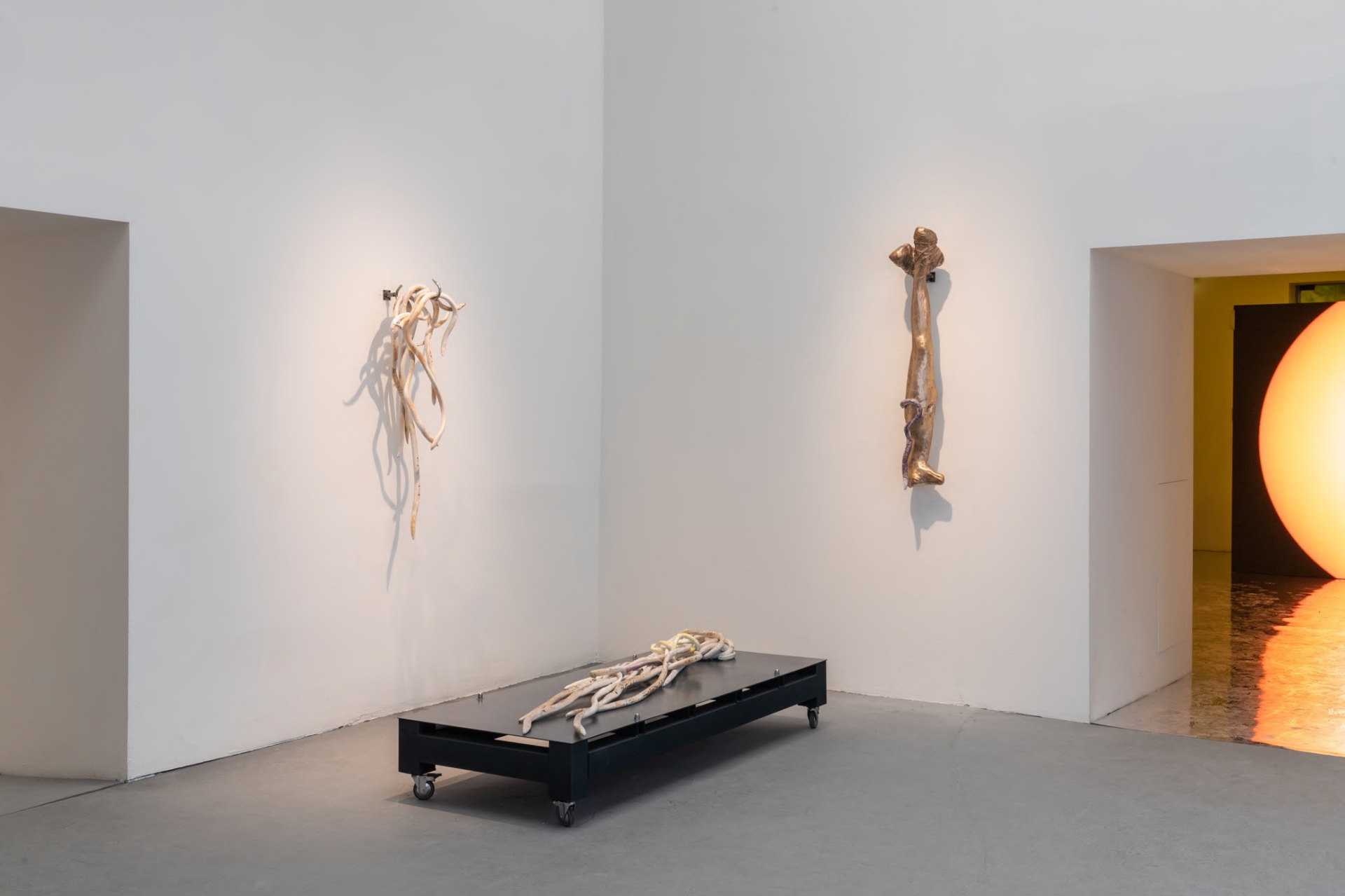
The Milk of Dreams, 2022 Installation view at La Biennale di Venezia, Venice