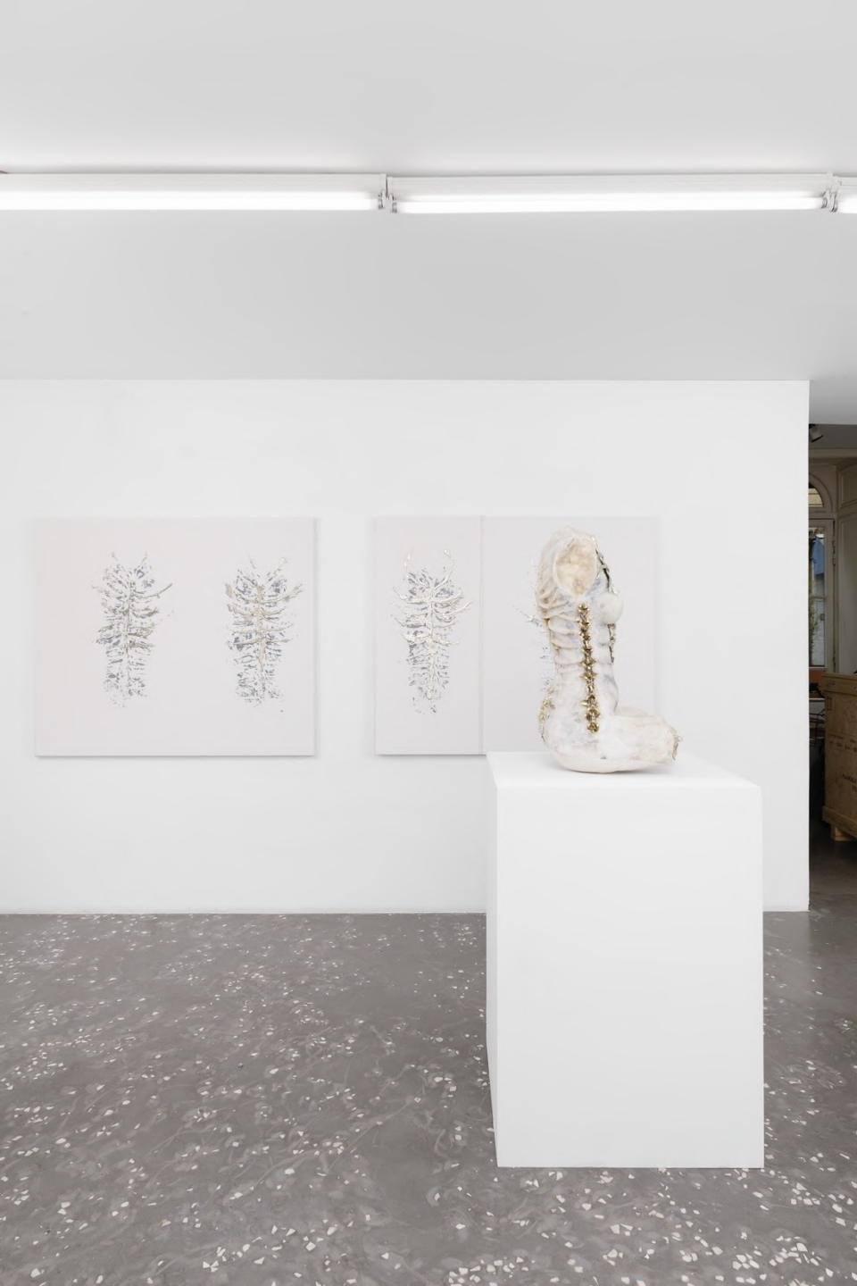
Compost Gyrl, 2023 Installation view at New Galerie, Paris