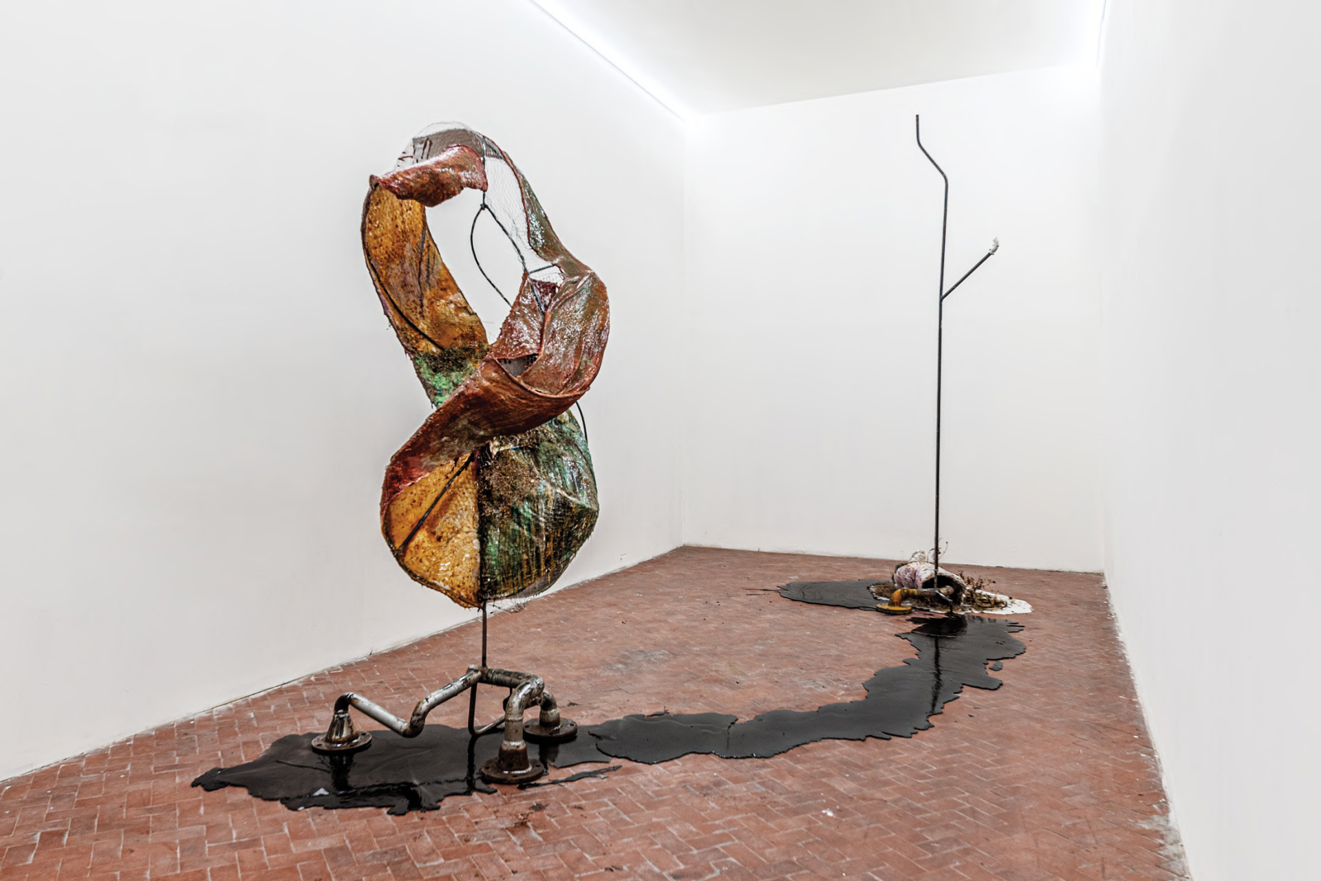
L'Armonia, 2020 Installation view at Manifattura Tabacchi, Florence