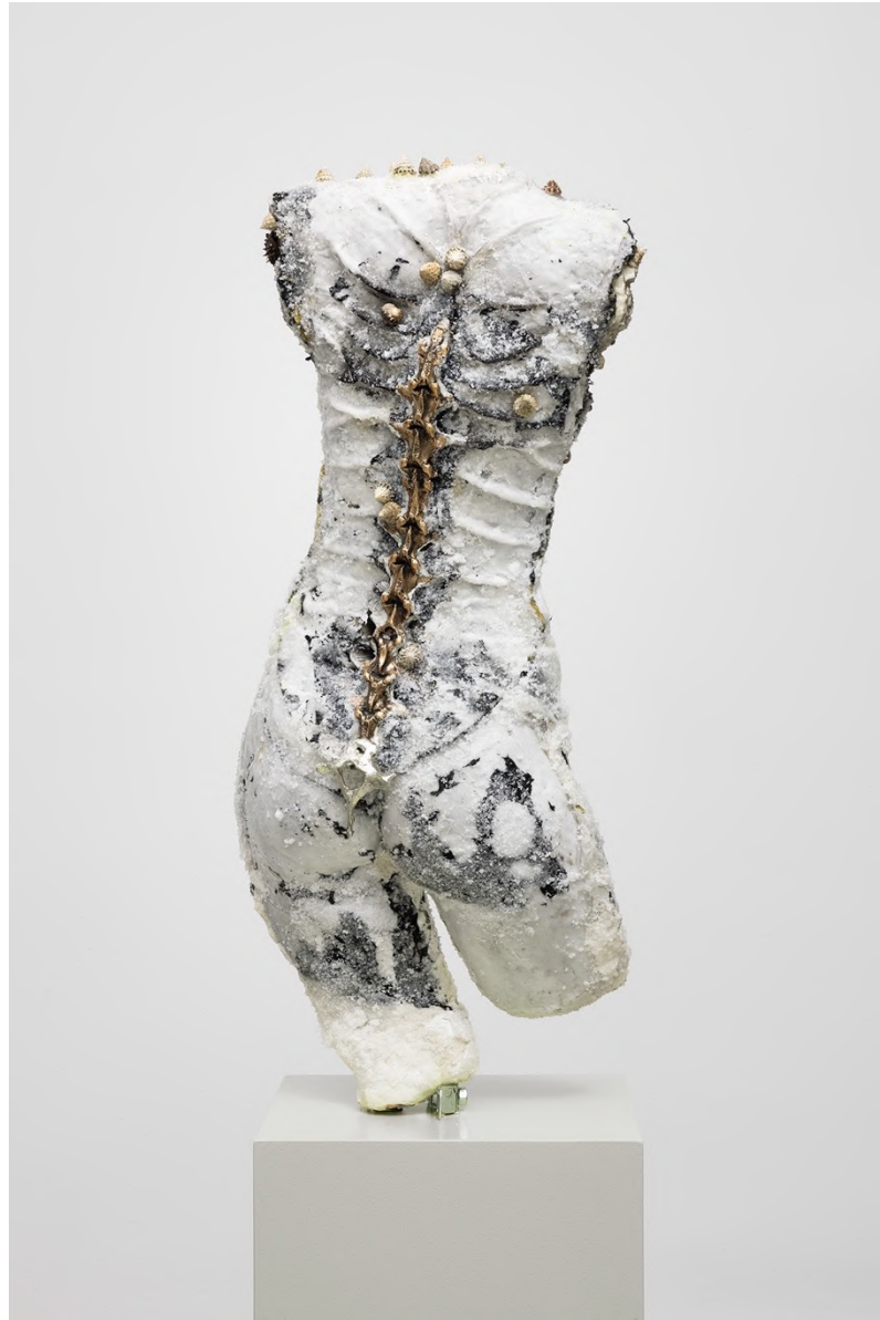
la Zona , 2023 Installation view at Francesca Minini, Milan