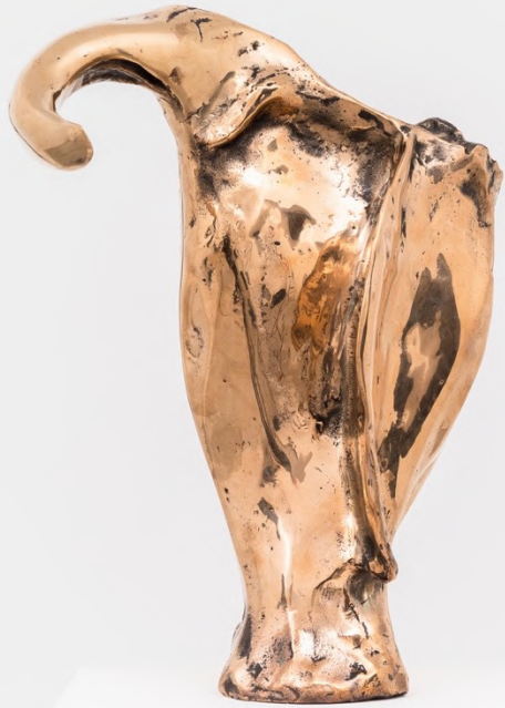
Aphros , 2022 Installation view at Rolando Anselmi Galerie, Rome