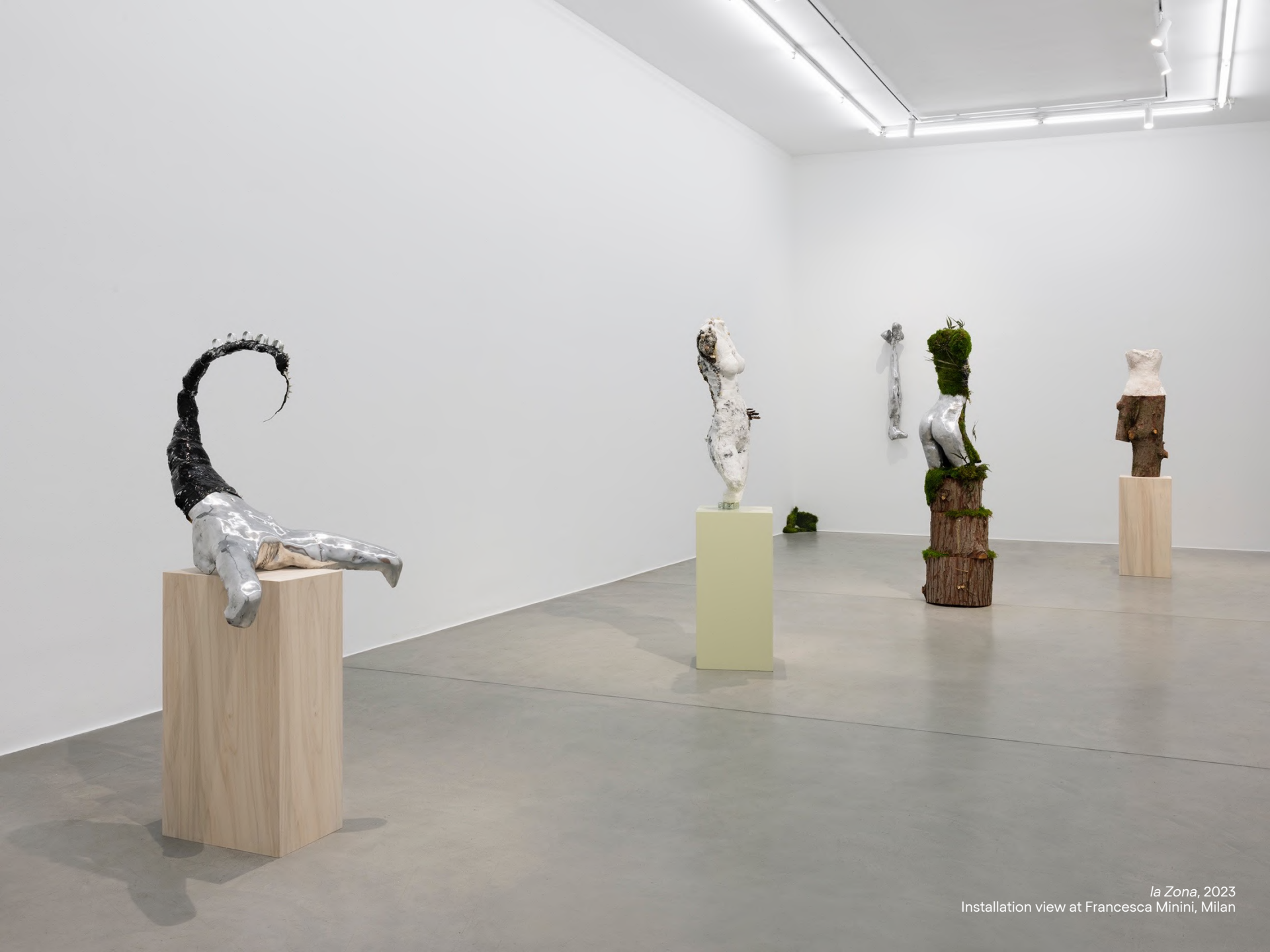
la Zona , 2023 Installation view at Francesca Minini, Milan