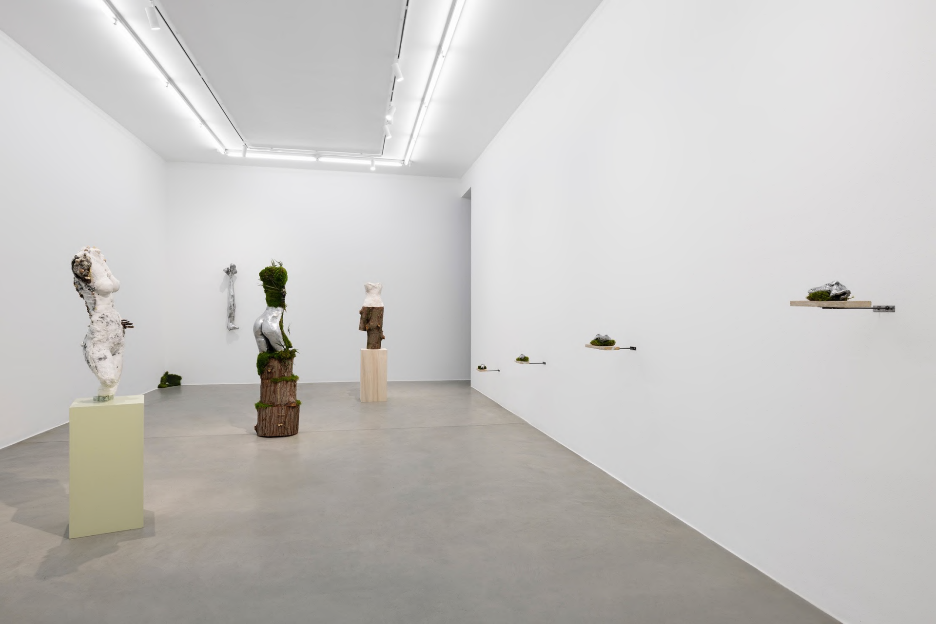
la Zona , 2023 Installation view at Francesca Minini, Milan