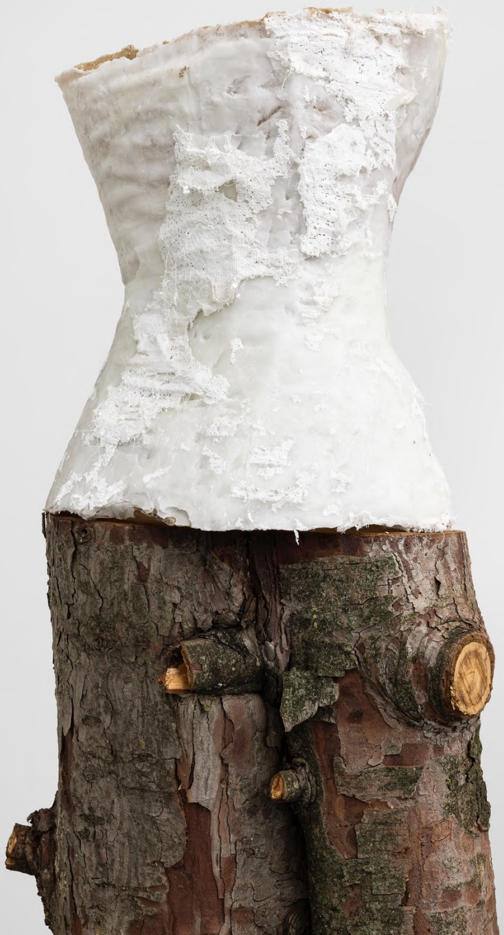
la Zona , 2023 Installation view at Francesca Minini, Milan