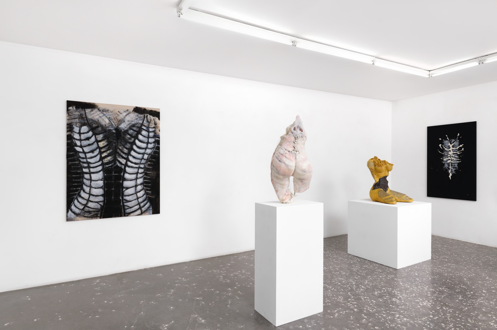
Compost Gyri, 2023 Installation view at New Galerie, Paris