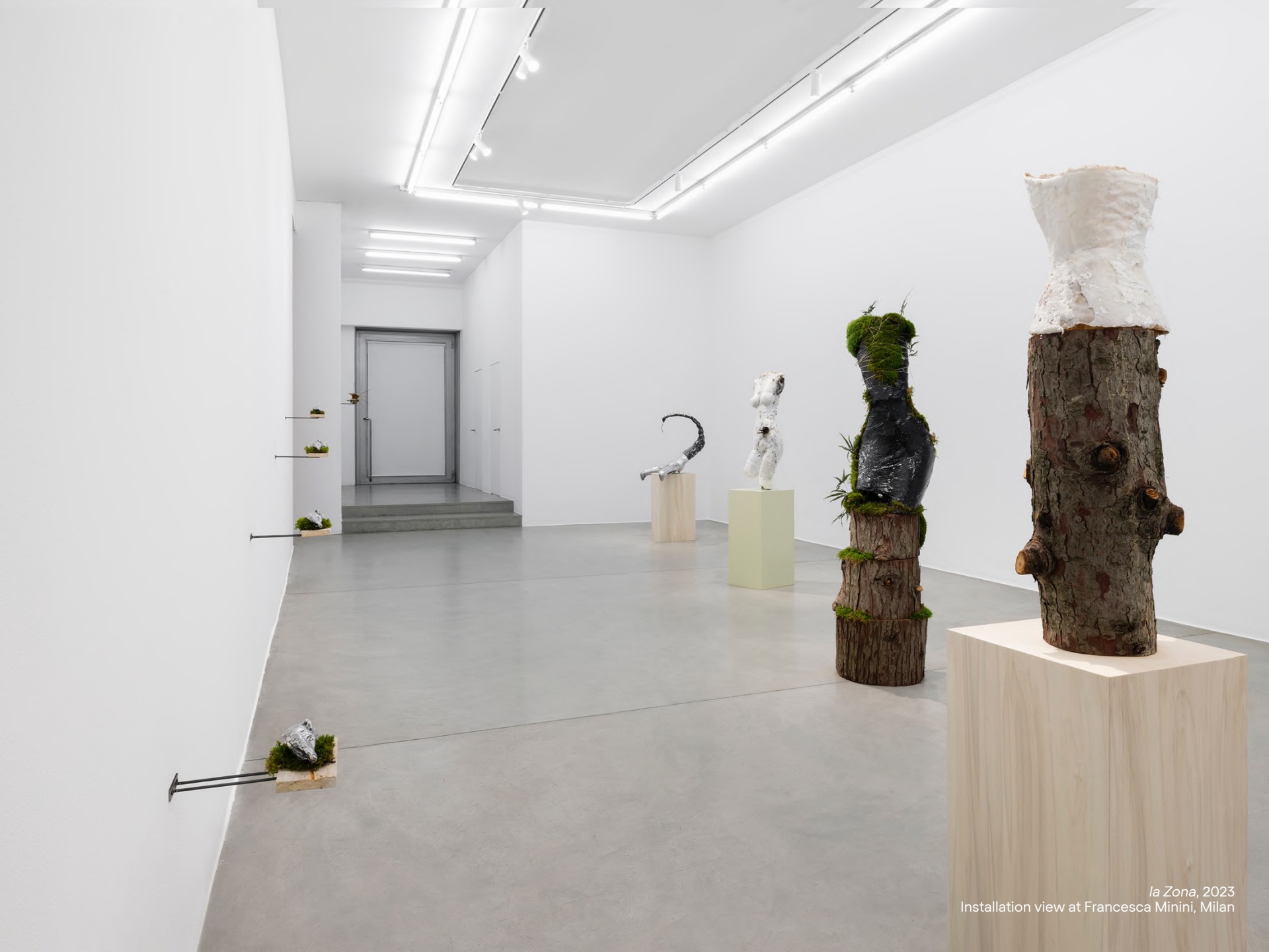
la Zona , 2023 Installation view at Francesca Minini, Milan