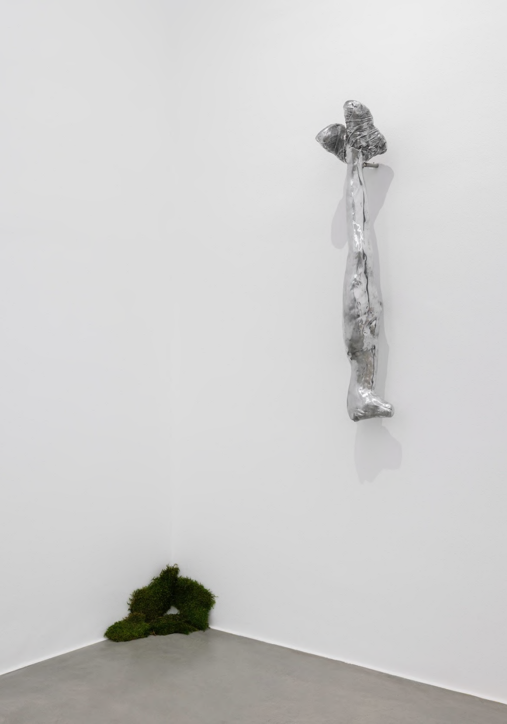
la Zona , 2023 Installation view at Francesca Minini, Milan