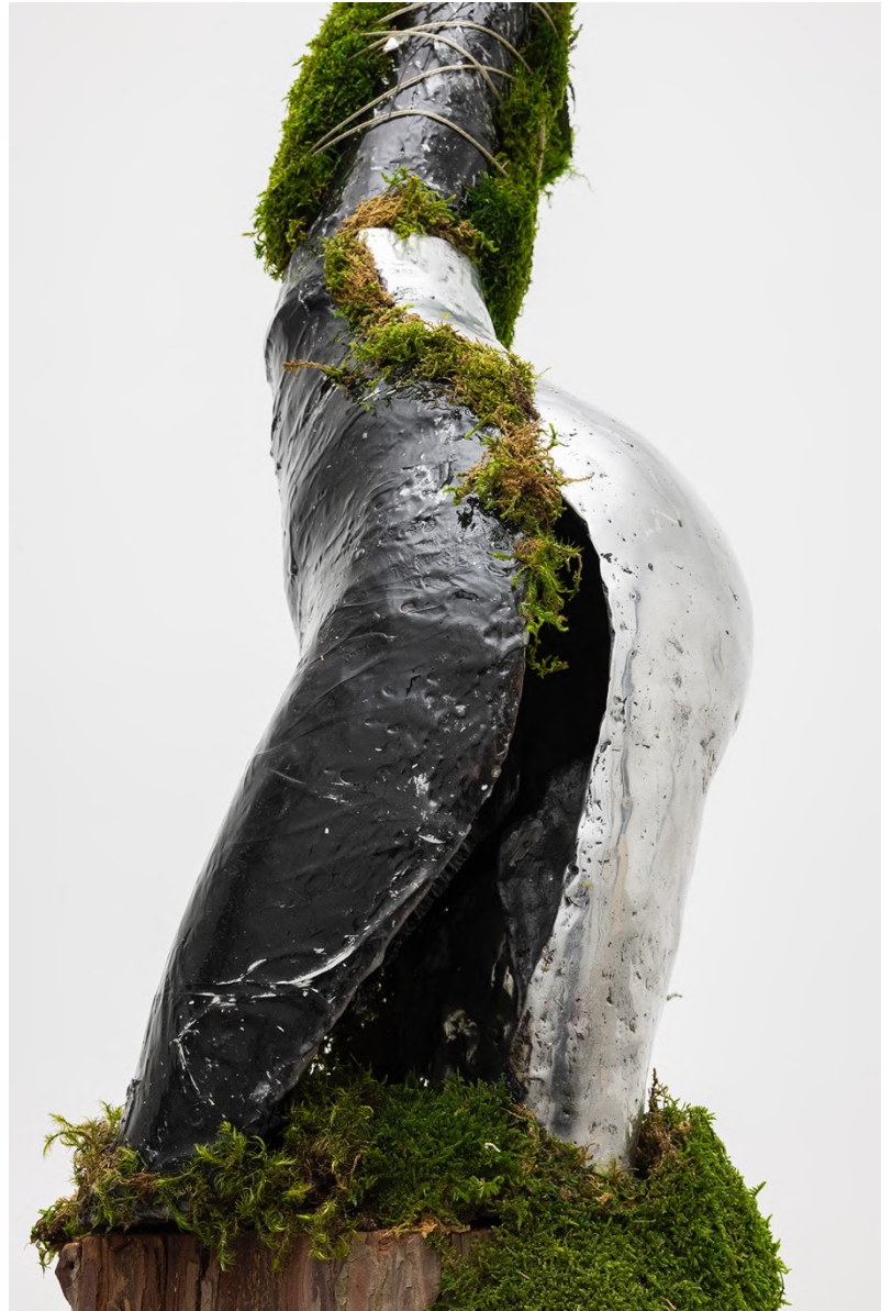
la Zona , 2023 Installation view at Francesca Minini, Milan