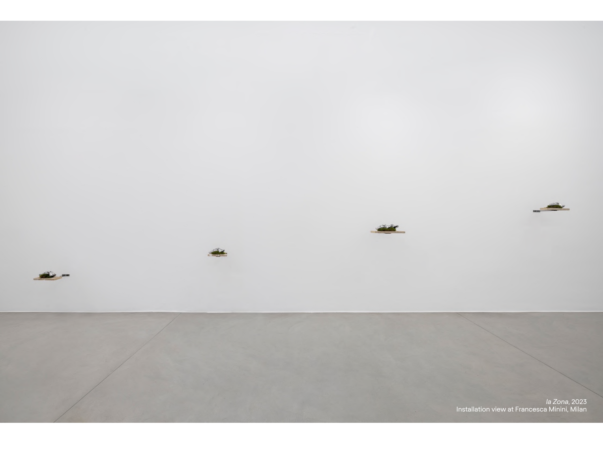
la Zona, 2023 Installation view at Francesca Minini, Milan