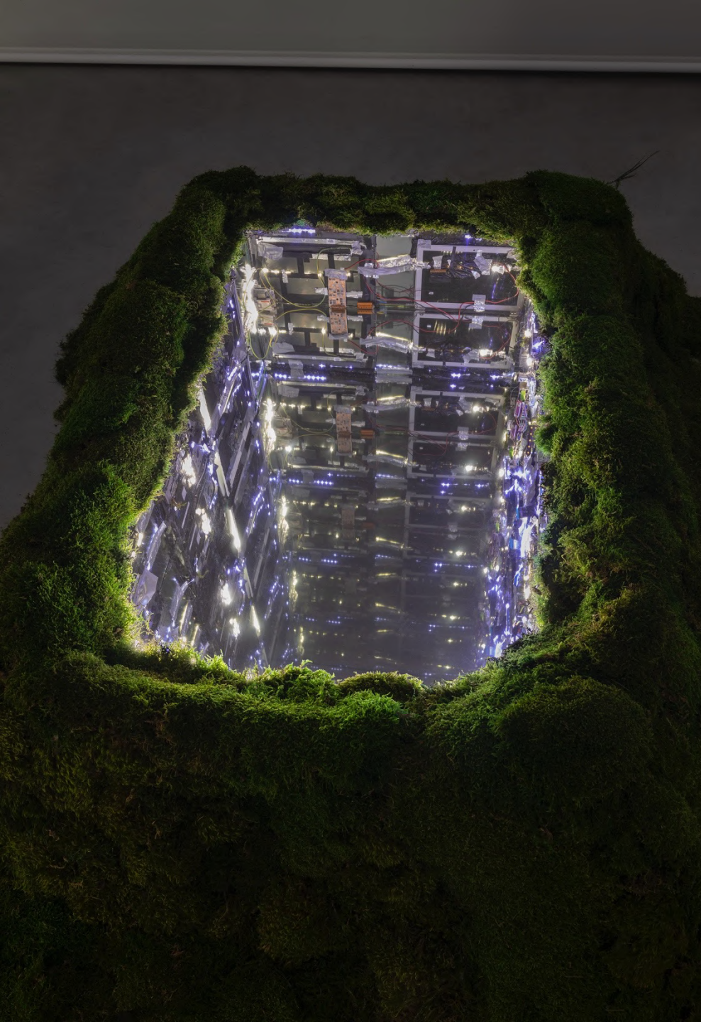
la Zona , 2023 Installation view at Francesca Minini, Milan