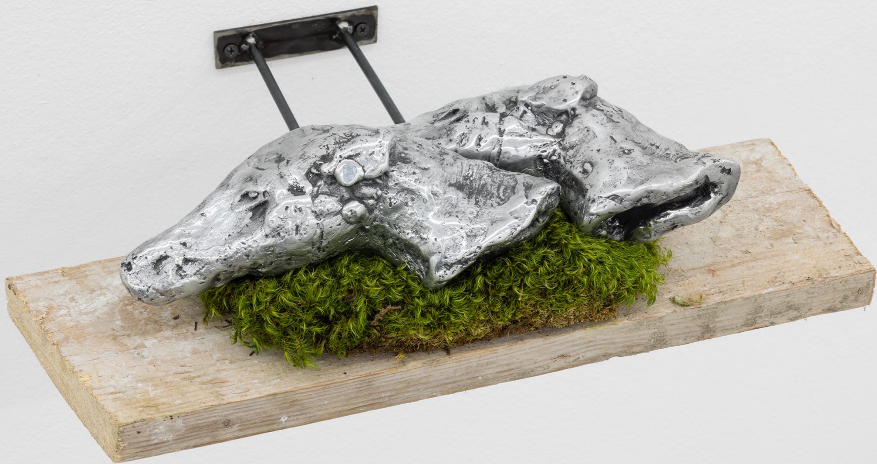
la Zona , 2023 Installation view at Francesca Minini, Milan