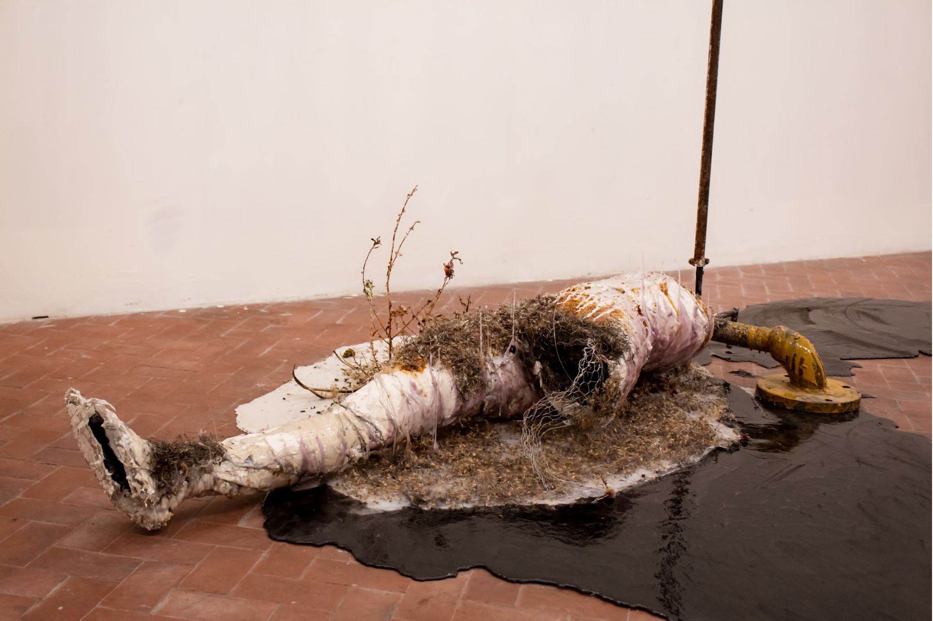
L'Armonia, 2020 Installation view at Manifattura Tabacchi, Florence