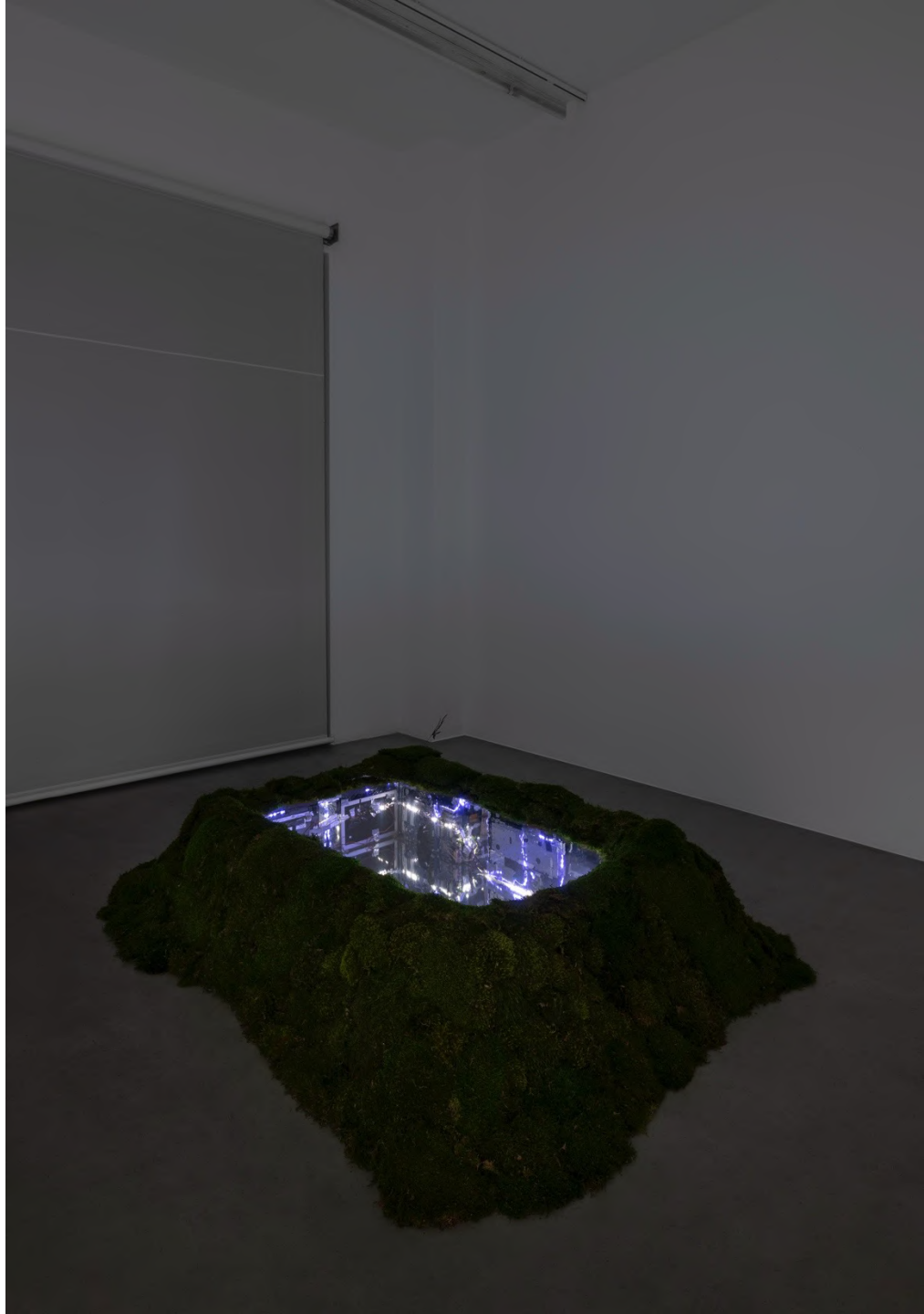
la Zona , 2023 Installation view at Francesca Minini, Milan