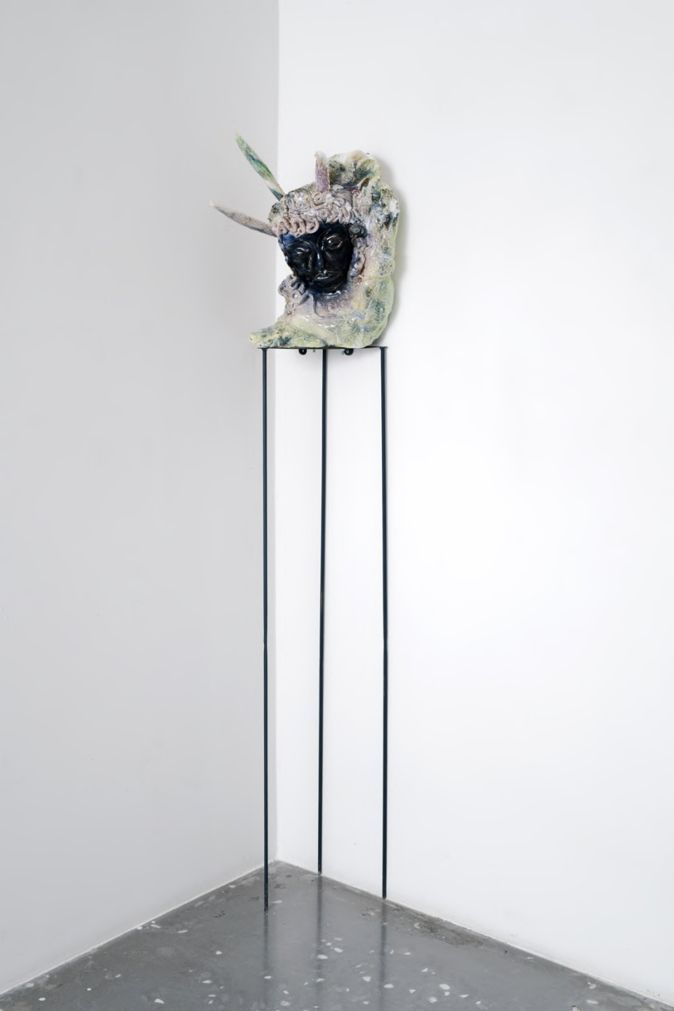
Oh I love Barbie, but I think she's gotten really bad... , 2022 Installation view at the New Galerie, Paris