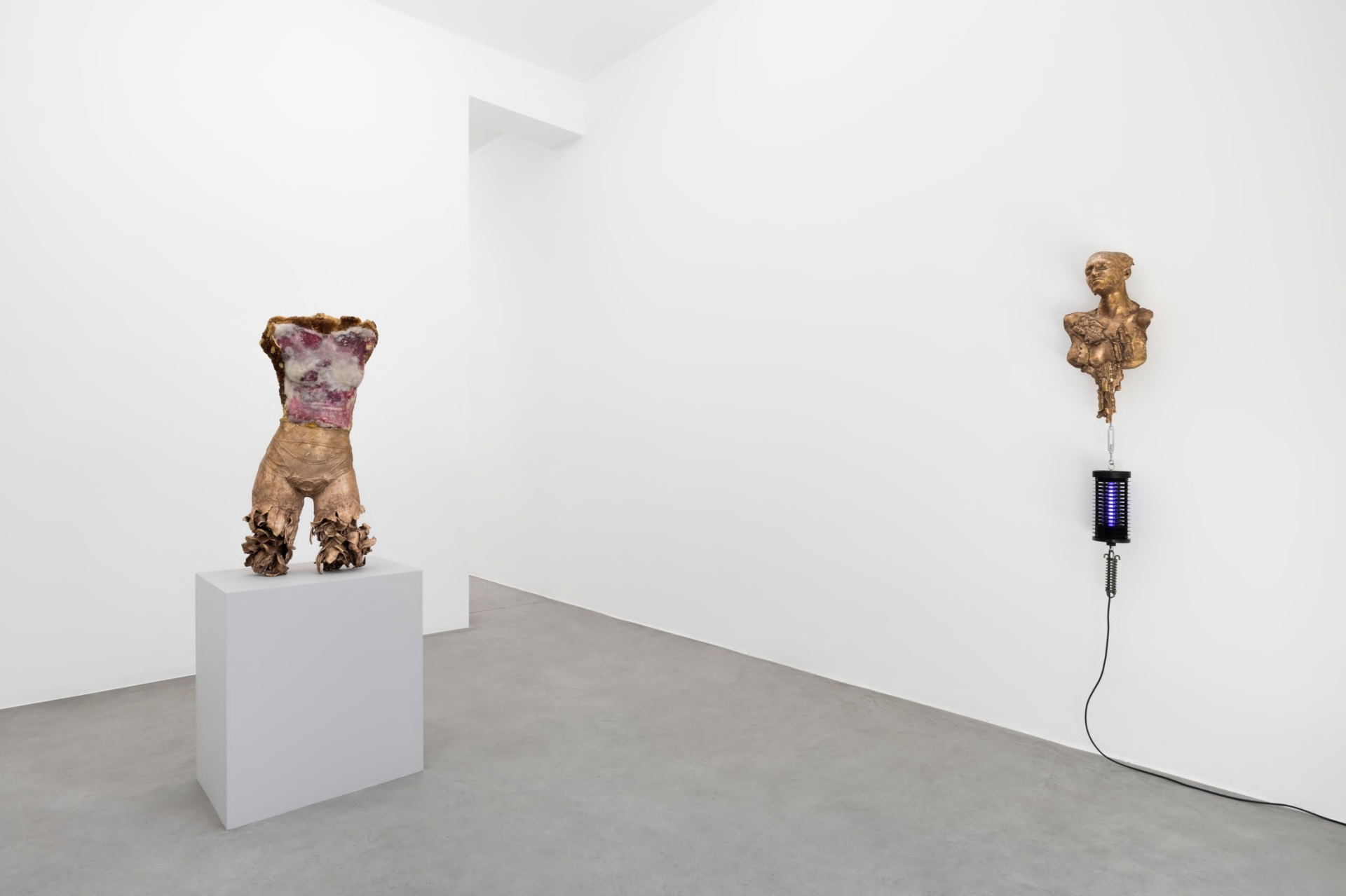
second best scenario, 2022 Installation view at Francesca Minini, Milan