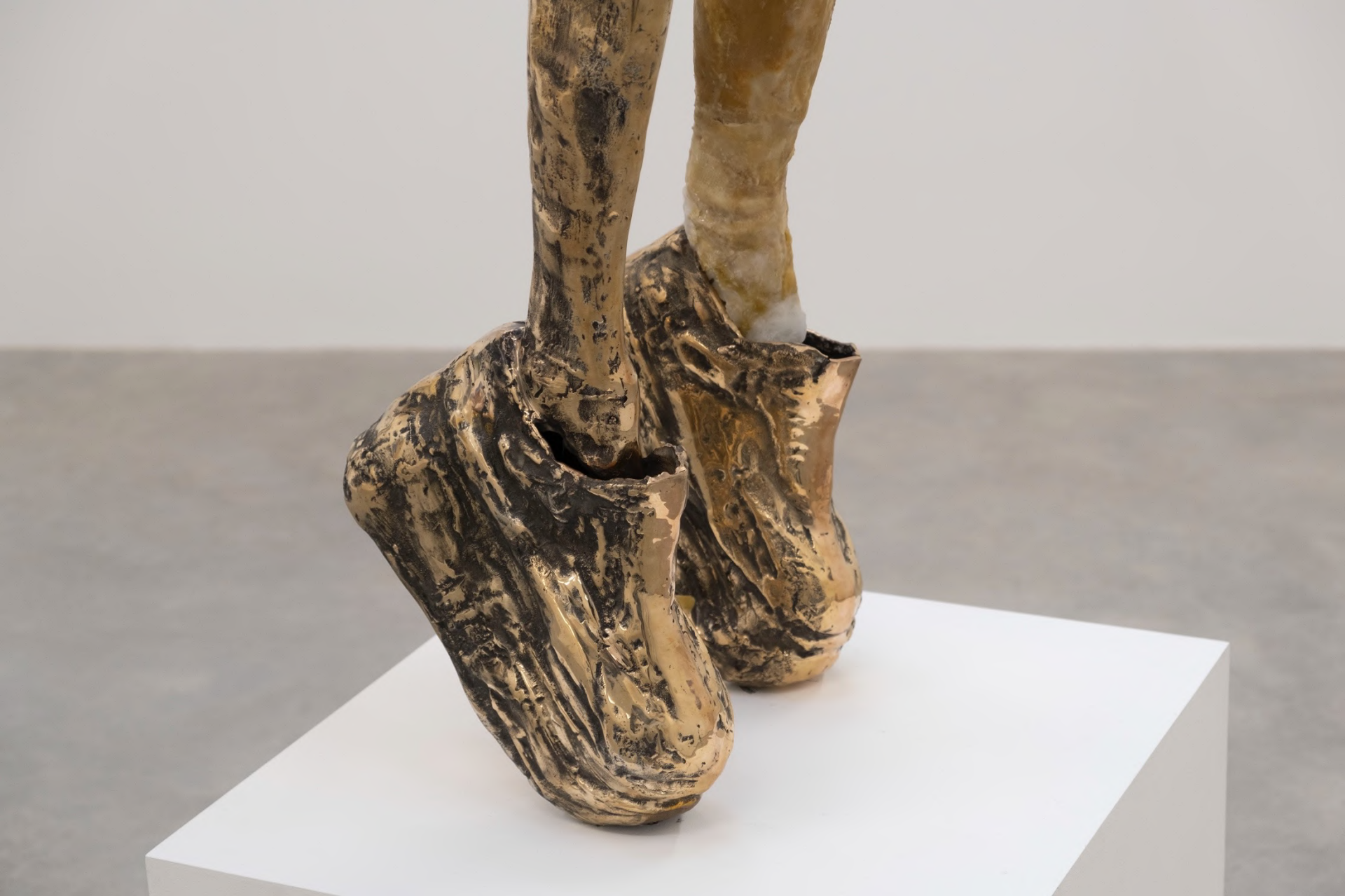
Party in the Blitz, 2023 Installation view at MAMOTH, London