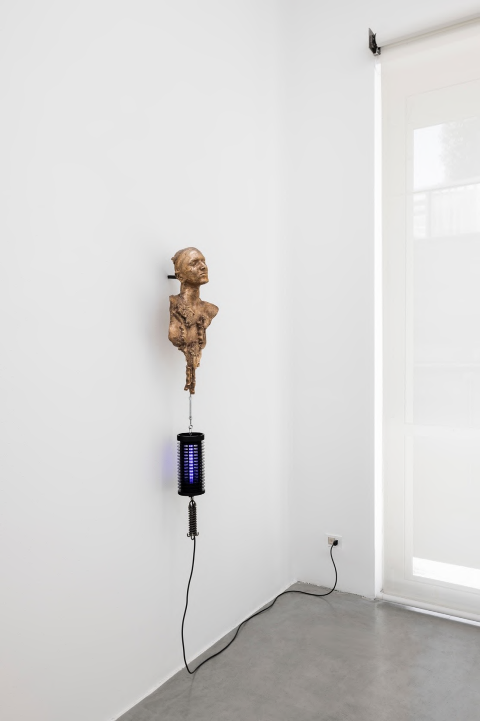
second best scenario, 2022 Installation view at Francesca Minini, Milan