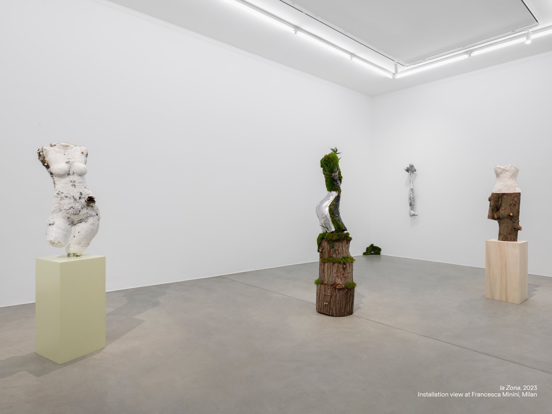
la Zona , 2023 Installation view at Francesca Minini, Milan