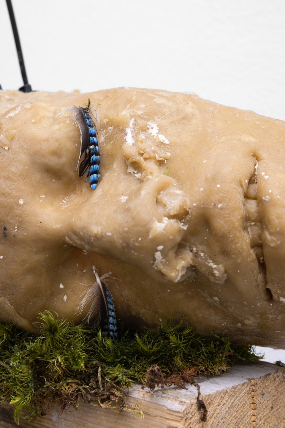
la Zona , 2023 Installation view at Francesca Minini, Milan