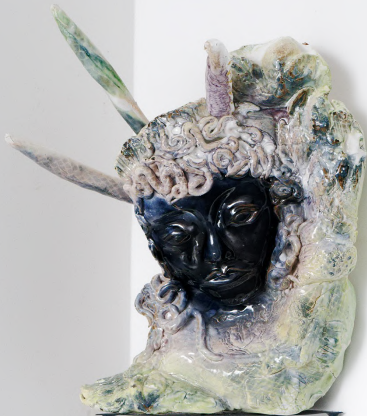
Oh I love Barbie, but I think she's gotten really bad... , 2022 Installation view at the New Galerie, Paris