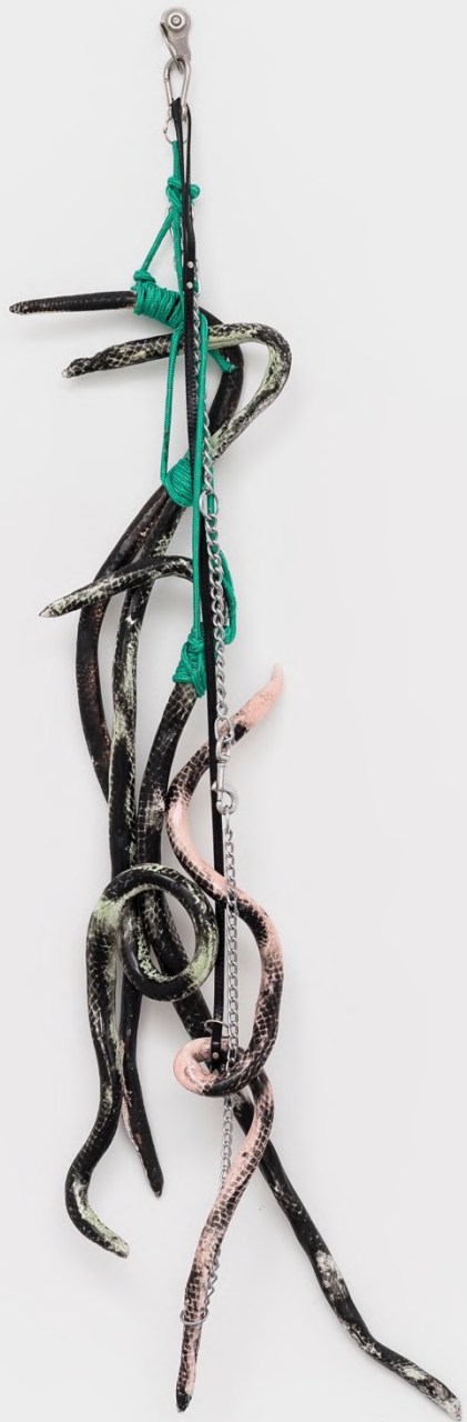
Aphros , 2022 Installation view at Rolando Anselmi Galerie, Rome