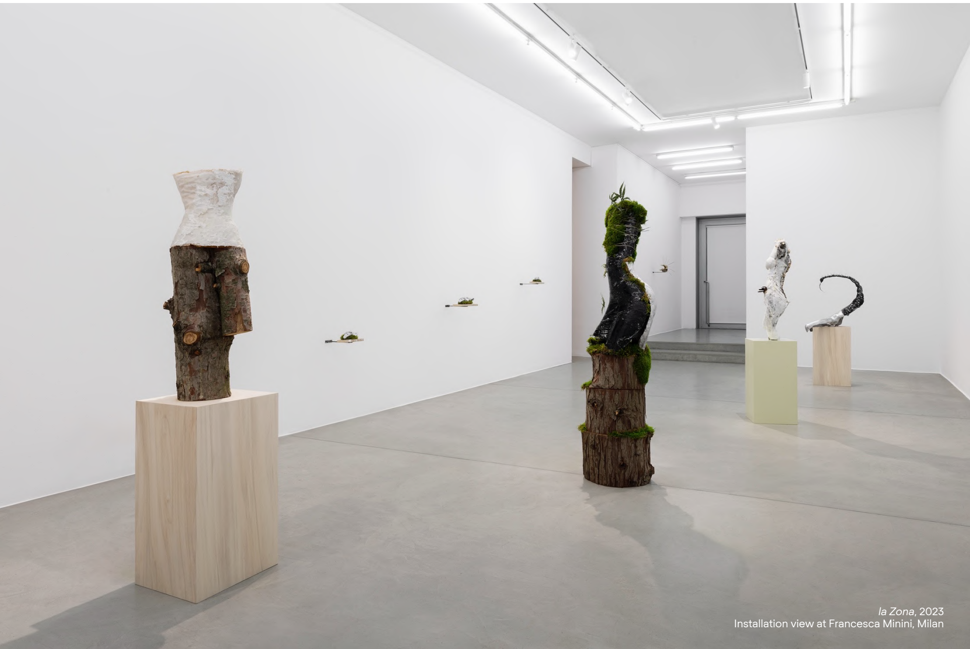
la Zona, 2023 Installation view at Francesca Minini, Milan