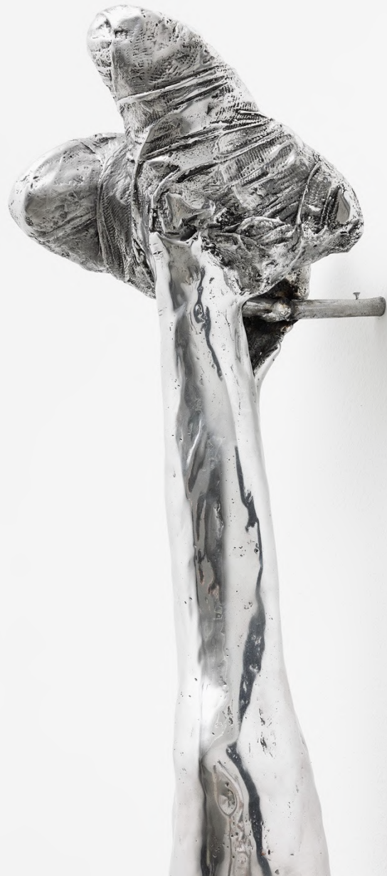
la Zona , 2023 Installation view at Francesca Minini, Milan