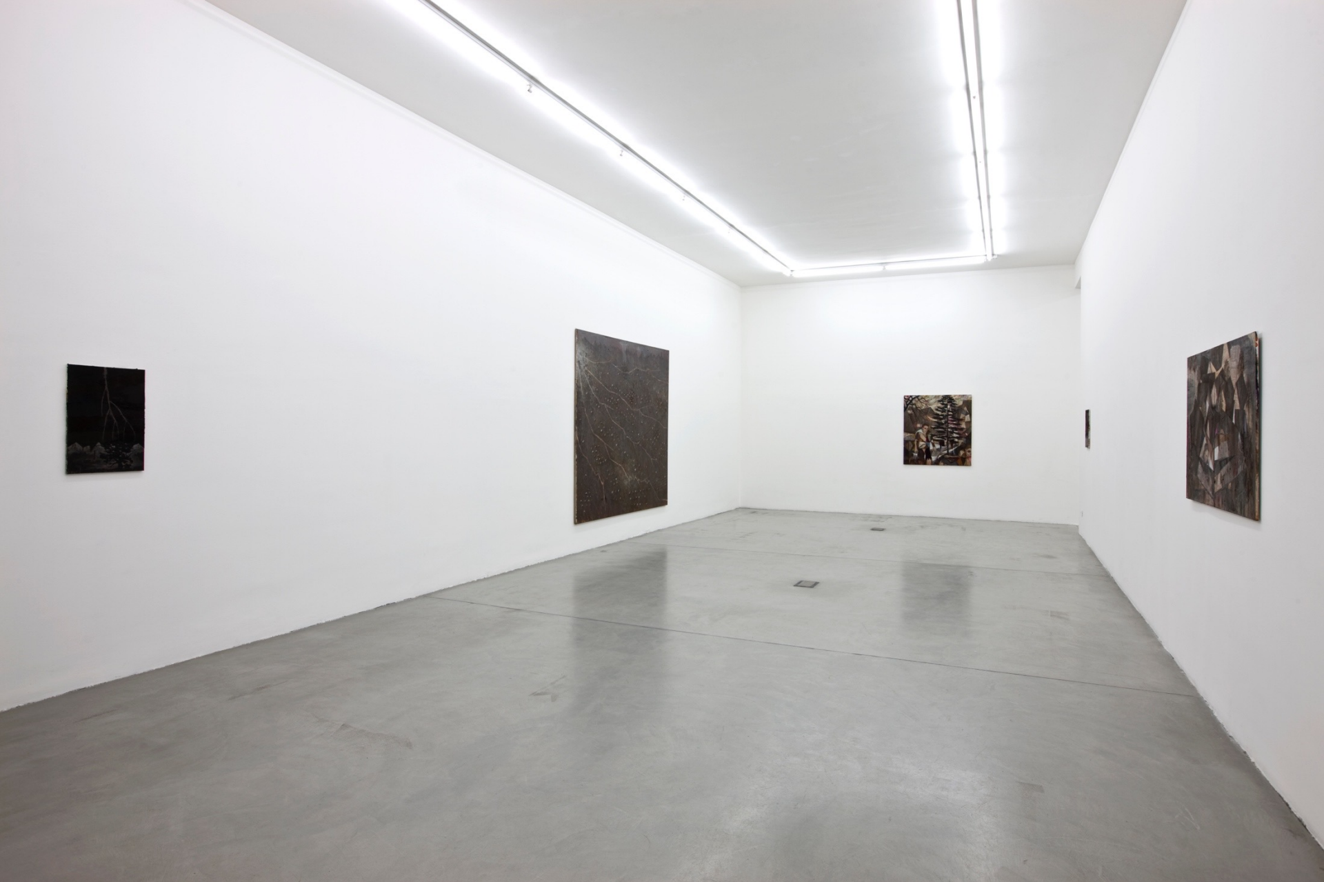
Chiffon Rouge , 2011 Installation view at Francesca Minini, Milan