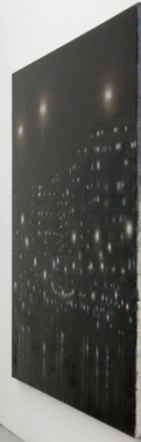
ARMIN BOEHM, 2008 Installation view at Francesca Minini, Milan