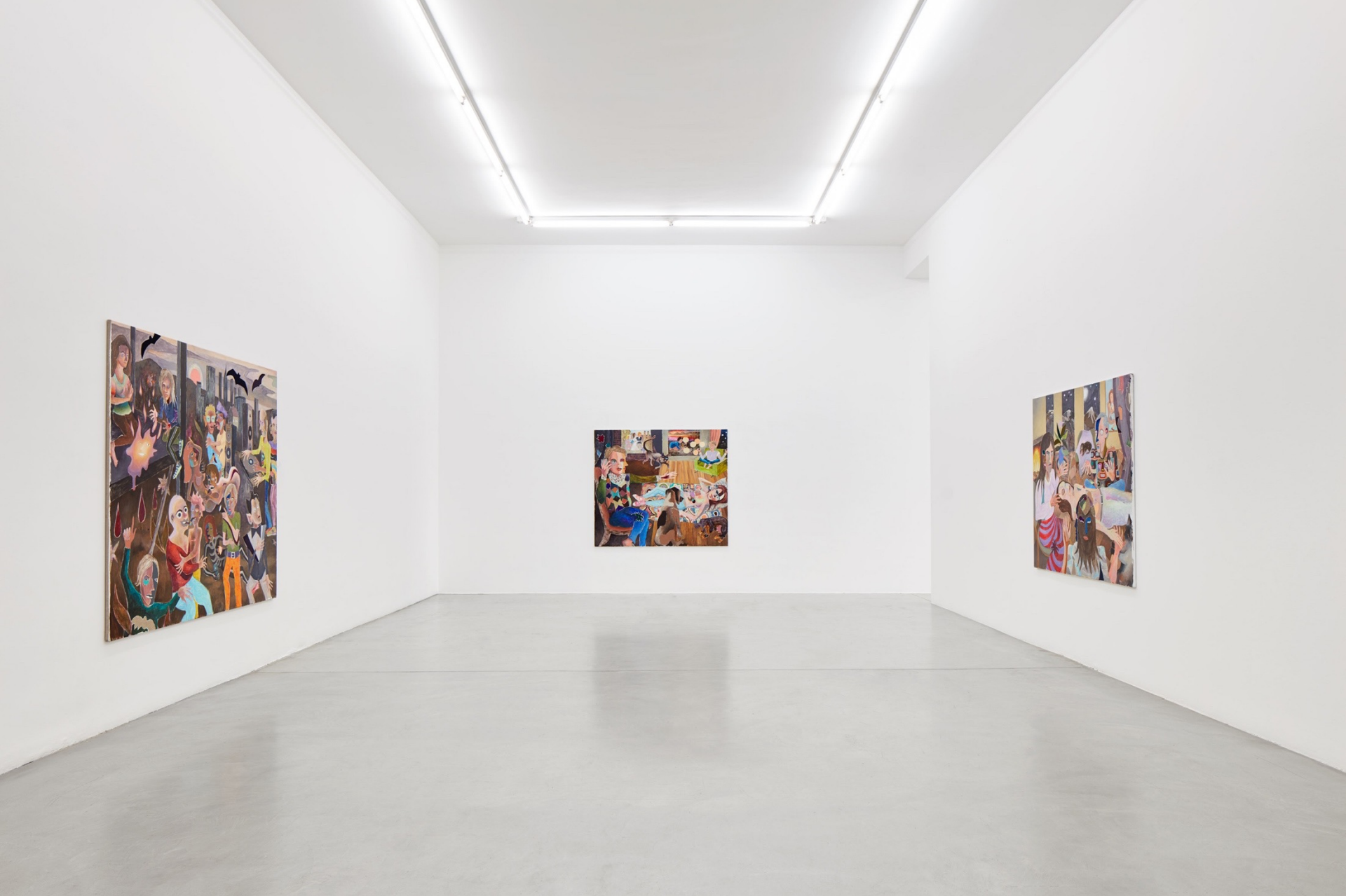
Intimacy and vulnerability, 2017 Installation view at Francesca Minini, Milan