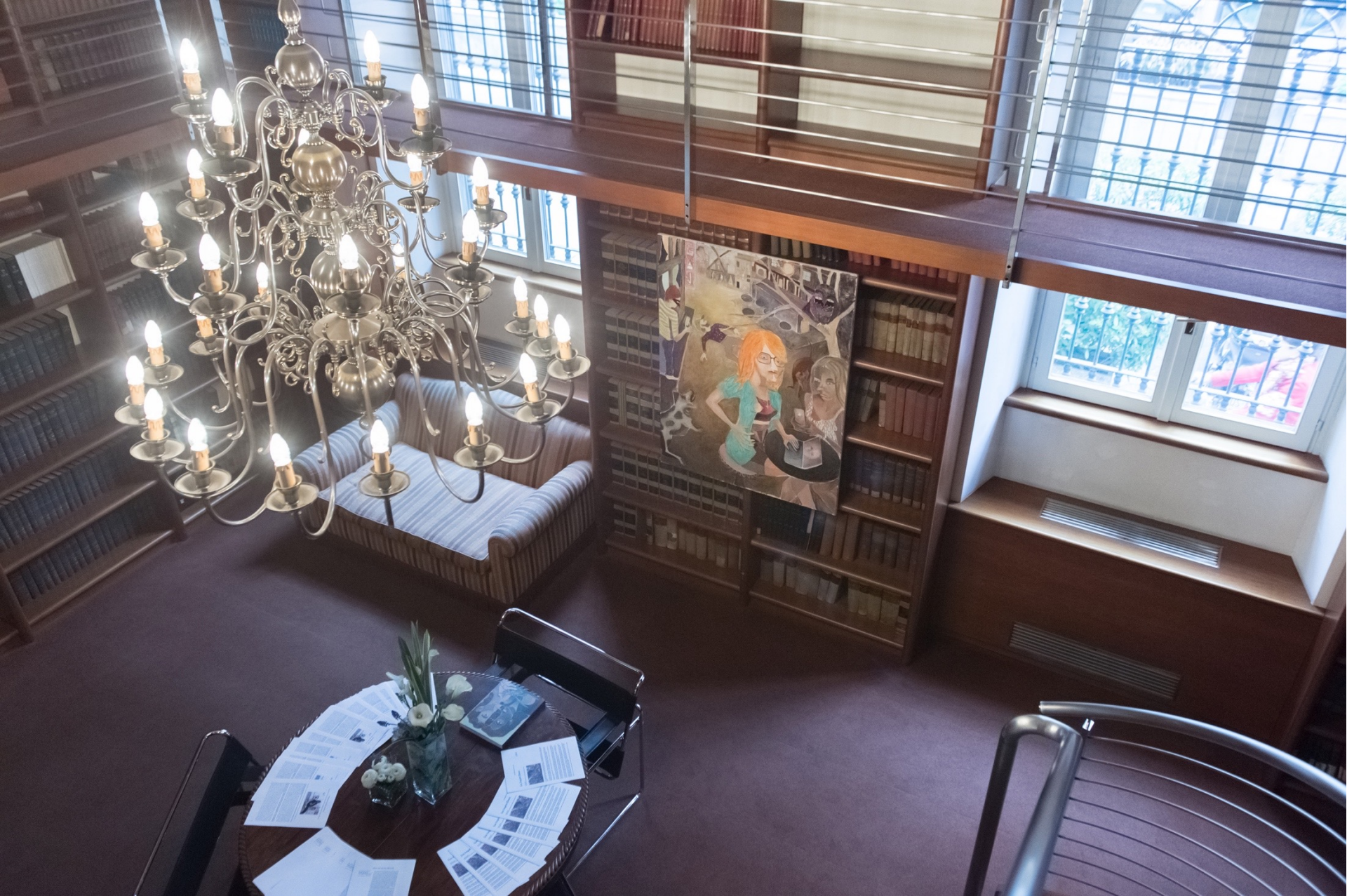
Mesmerized, 2019 Installation view at Carnelutti Studio Legale Associato, Milan