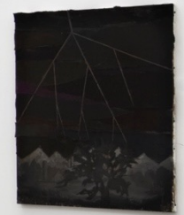
Chiffon Rouge , 2011 Installation view at Francesca Minini, Milan