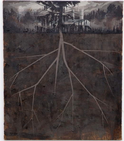
Chiffon Rouge , 2011 Installation view at Francesca Minini, Milan