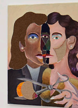
Intimacy and vulnerability, 2017 Installation view at Francesca Minini, Milan