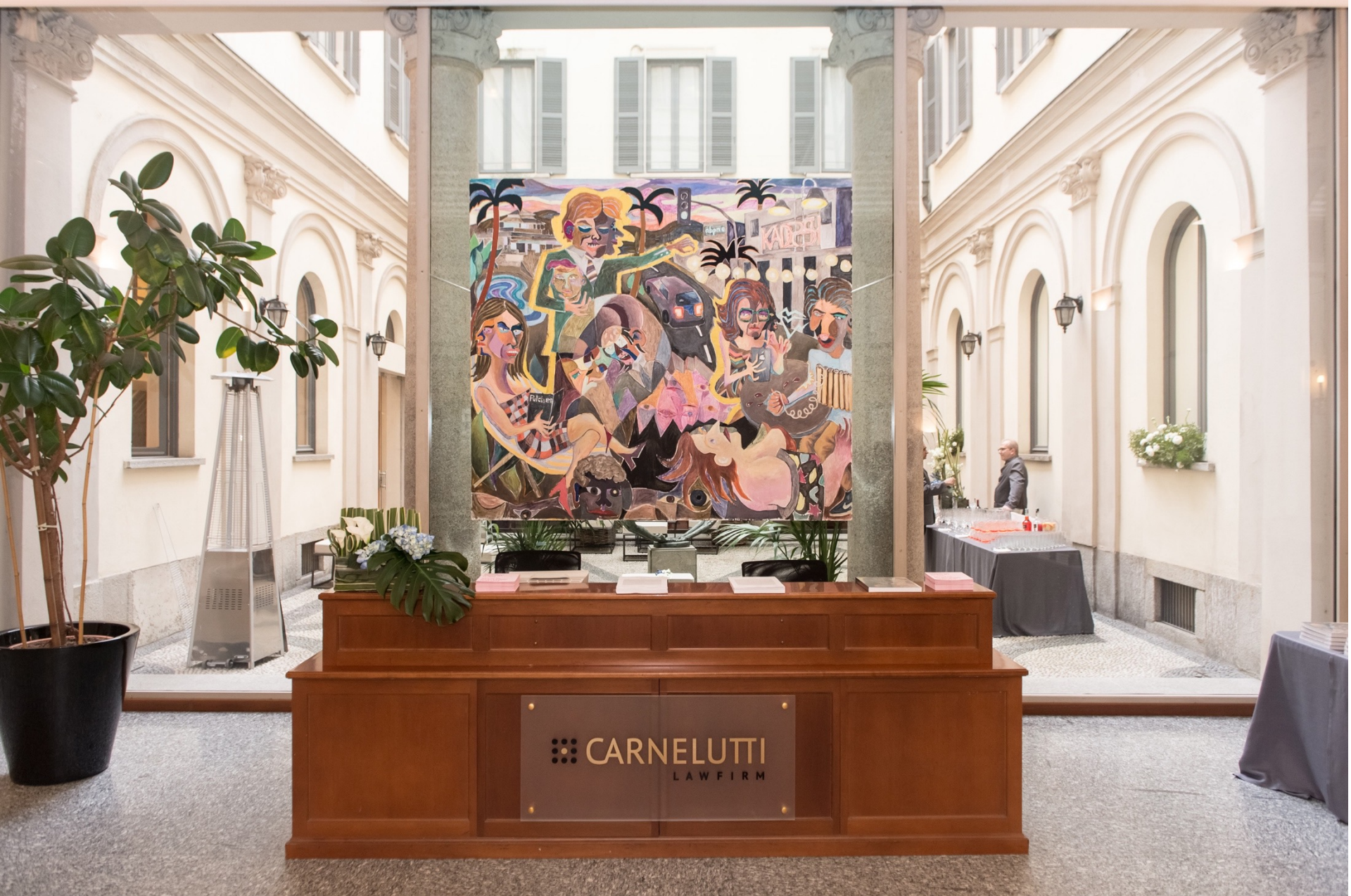
Mesmerized, 2019 Installation view at Carnelutti Studio Legale Associato, Milan