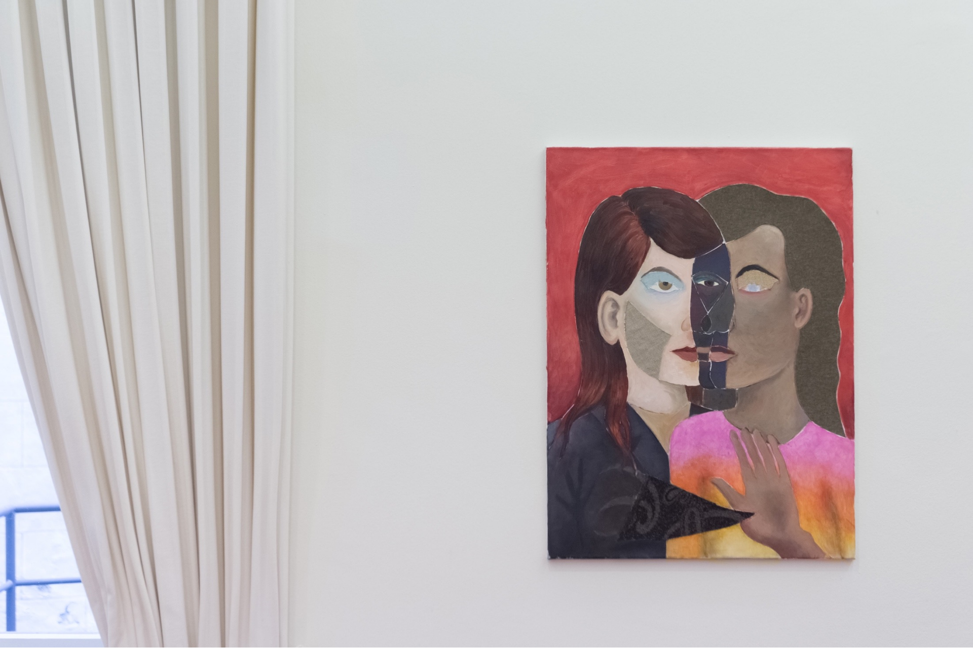
Mesmerized, 2019 Installation view at Carnelutti Studio Legale Associato, Milan