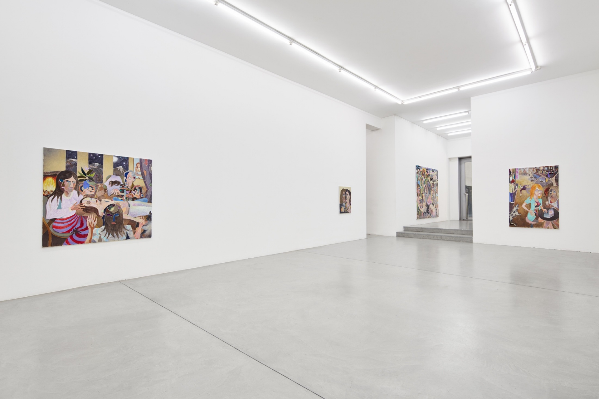
Intimacy and vulnerability, 2017 Installation view at Francesca Minini, Milan