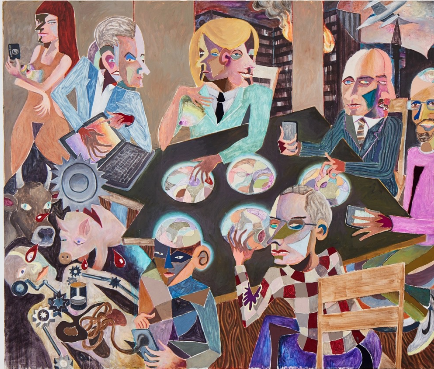
Intimacy and vulnerability , 2017 Installation view at Francesca Minini, Milan