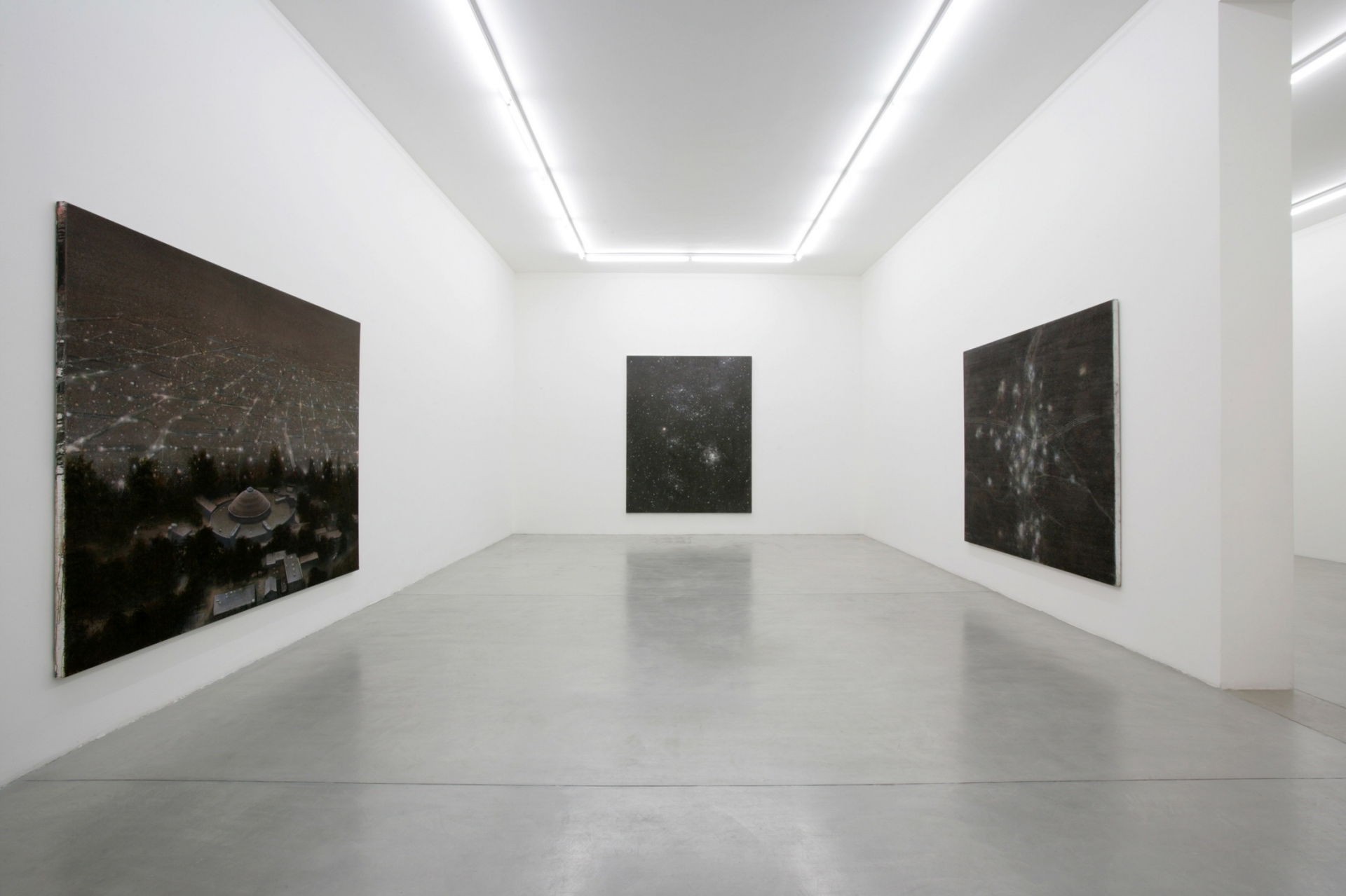
ARMIN BOEHM, 2008 Installation view at Francesca Minini, Milan