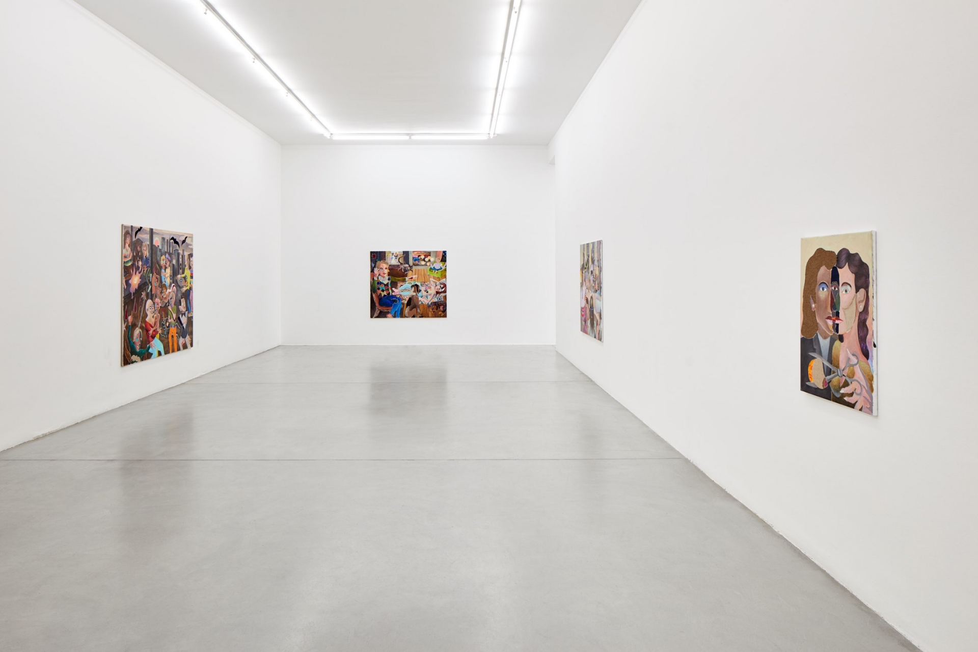
Intimacy and vulnerability, 2017 Installation view at Francesca Minini, Milan