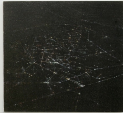
ARMIN BOEHM, 2008 Installation view at Francesca Minini, Milan